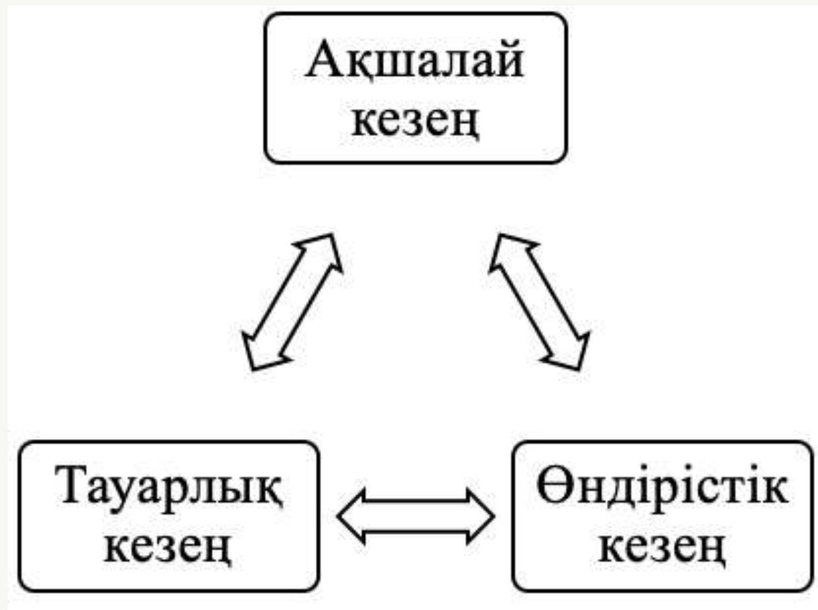
Сурет – Айналым құраларының қозғалысы

Айналым құралдры өз қозғалысында тізбектеу жүргізілетін үш кезеңді өтеді: ақшалай, өндірістік, және тауарлық